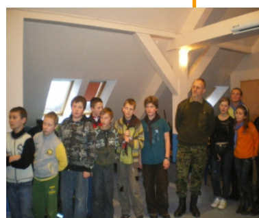
Apel na podsumowaniu turnieju drużyn harcerskich