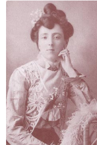
Lucy Maud Montgomery