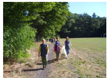
Klasa piąta sprząta boisko