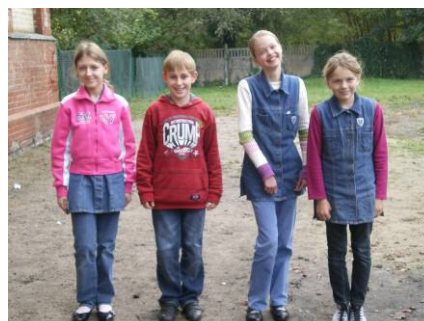
Nowy Samorząd Szkolny