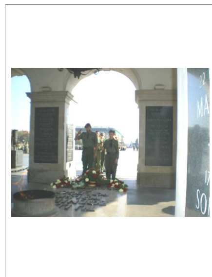
Złożenie kwiatów na Grobie Nieznanego Żołnierza